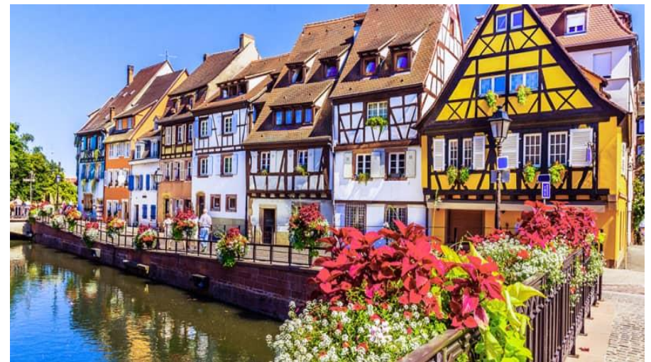
Altstadt von Colmar

Unterkunft: Hotel greet 83 Rte de Bâle F - 68000 Colmar T +33 3 89 24 14 79