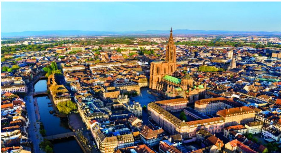
Kathedrale in Strasbourg