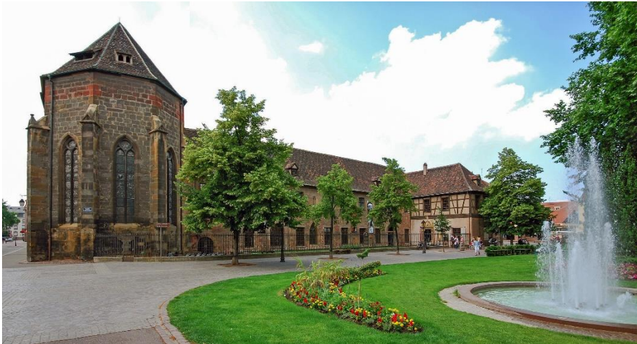
Museum Unterlinden Colmar